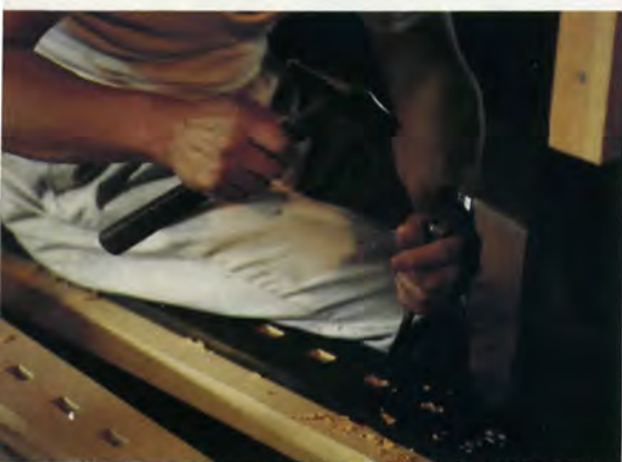
Top: Intent on his task, one of the carpenters chisels holes in a beam to support the latticed bay windows forming the shop front. Bottom: An artist with chisel, this workman knows how to whittle and fit every piece in the complex design of a kyo-machiya house.