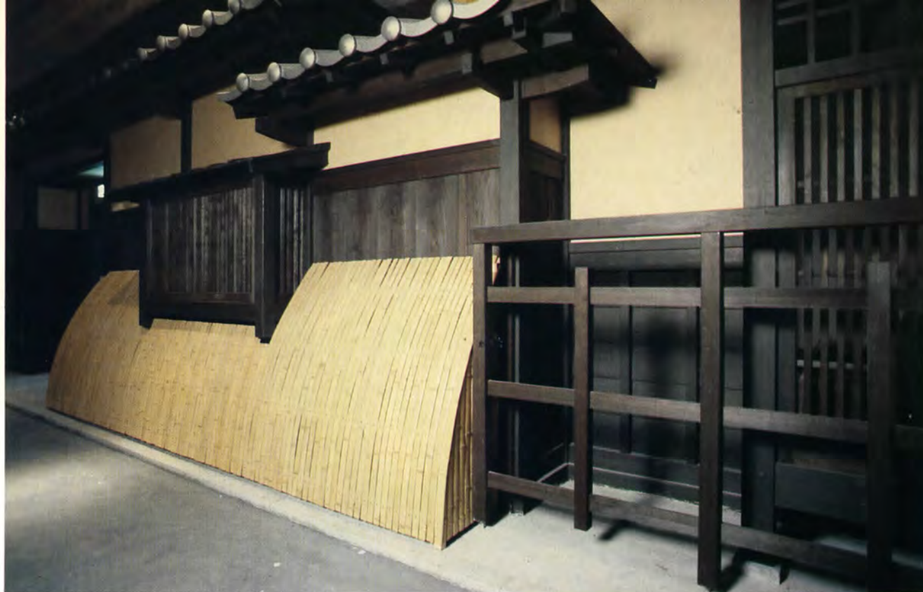
Above: A hallway recreates the narrow lane of a Kyoto street and leads to the front of a silk weaver's 150-year-old home.